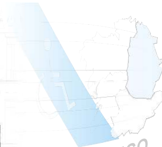
COGAMI - LUGO