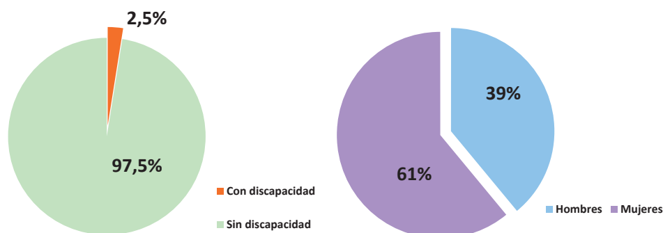
Graph 1. People qualified in Sociology according to situation of disability and sex.

Note: It should be taken into consideration that, for the purposes of estimating the volume of people qualified, the source used warns that "there is no information from the University Pablo de Olavide" (INE, 2016).