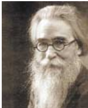
Ramón María del Valle Inclán creador de Max Estrella, protagonista de 'Luces de Bohemia'