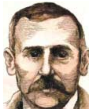
Benito Pérez Galdós retrata 'Misericordia' al moro ciego Almudena