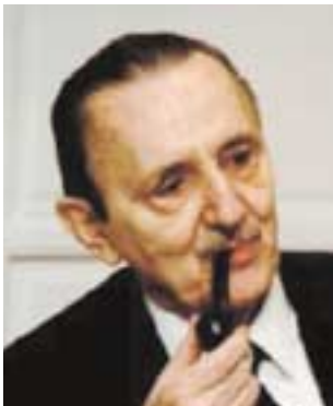
El dramaturgo Antonio Buero Vallejo aborda la ceguera en 'El concierto de San Ovidio'