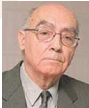
En 'Ensayo sobre la ceguera', el premio Nobel José Saramago explora en la voluntad humana