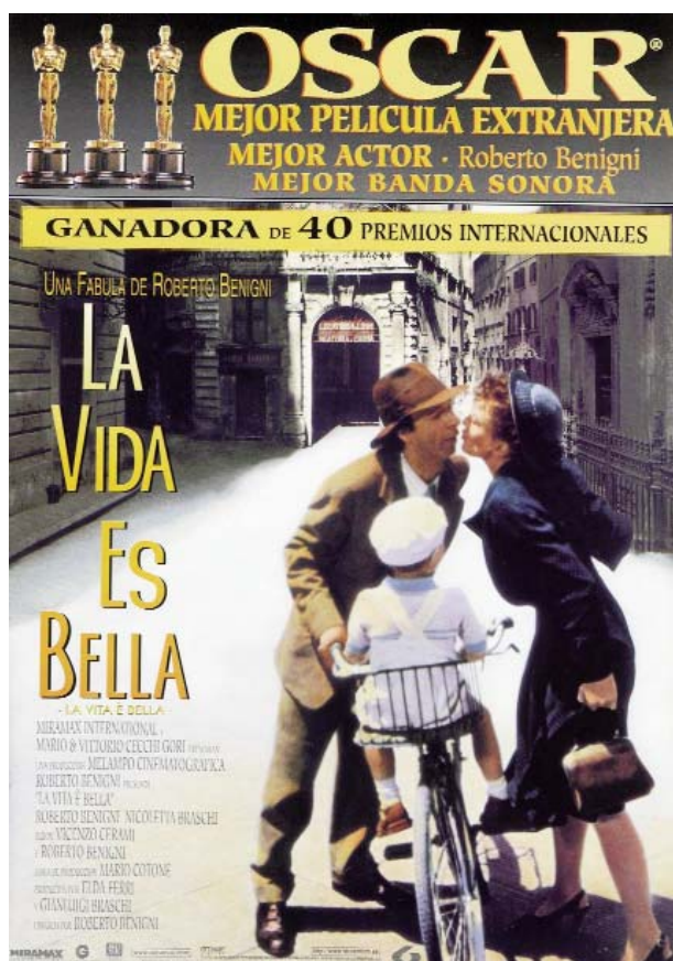
Foto 4: el humor fino de La vida es bella se plasma en el cartel que la promocionó

el humor es apropiado y cómo saber utilizarlo en la práctica diaria de los cuidados de una manera sensible y cómoda.