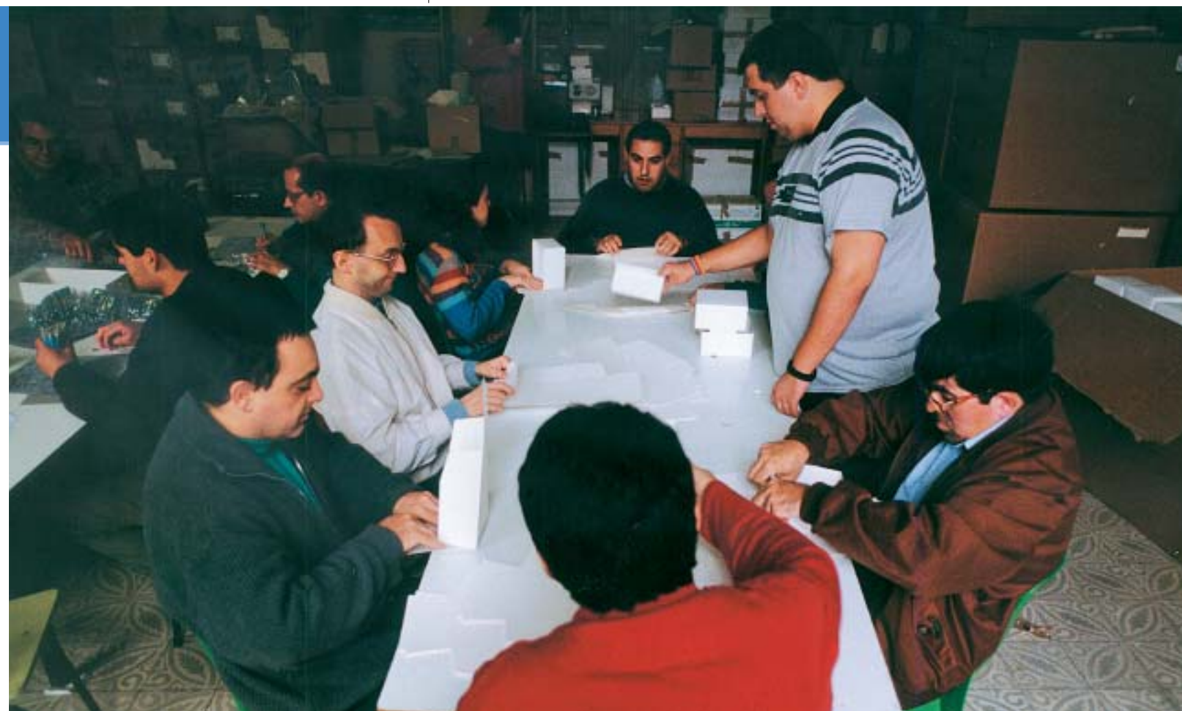
Los adultos con dificultades de aprendizaje suelen encontrarse con problemas a la hora de acceder al mundo laboral y desconocen la vía para satisfacer la formación profesional que necesitan.

En el ámbito laboral es necesario desarrollar una conciencia global, y la comprensión de factores competitivos, culturales y económicos que influyen en el ámbito internacional (Lankard, 1997) 16 . Esta autora