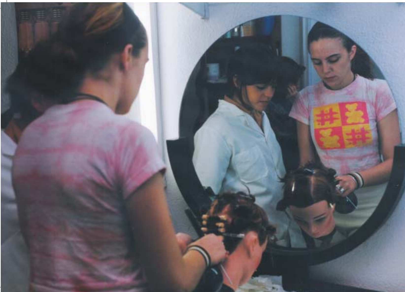
Los Centros Especiales de Empleo deben concebirse como empresa privada, y no como reducto de subsistencia de afectados, que ya tiene en sí una connotación discriminatoria

El grado de profesionalidad que alcanzan las personas con inteligencia límite está altamente vinculado a la labor que desarrolla el monitor, de ahí la importancia de la selección de los mismos para extraer las mejores cualidades de las personas a su cargo