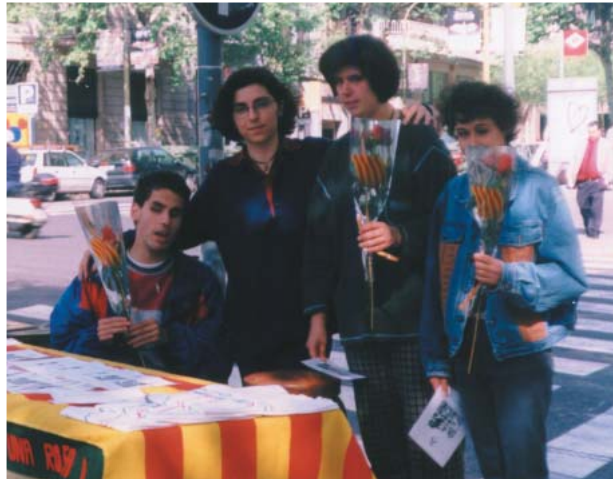
El lenguaje aparece como signo de la maduración cerebral, y es el que permite una buena capacidad de comunicación