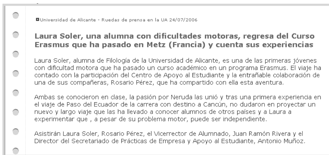
Figura 1. Ejemplo de noticia sobre alumna Erasmus con discapacidad