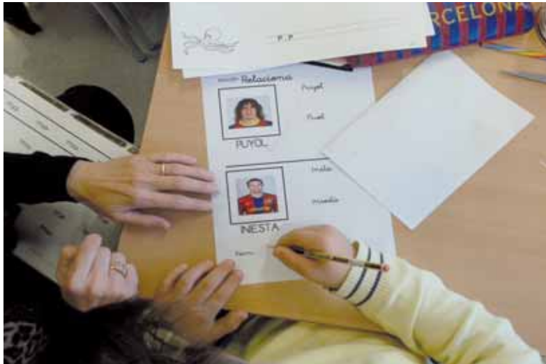
Imagen 3. Aprendemos partiendo de sus intereses

En un primer momento, todo el alumnado se distribuye en grupos para trabajar el tema que se quiere estudiar. De este modo, se permite que cada alumno desarrolle sus capacidades en función de sus intereses sin dejar de lado que dentro de cada grupo cada uno tiene un objetivo en el que debe profundizar.